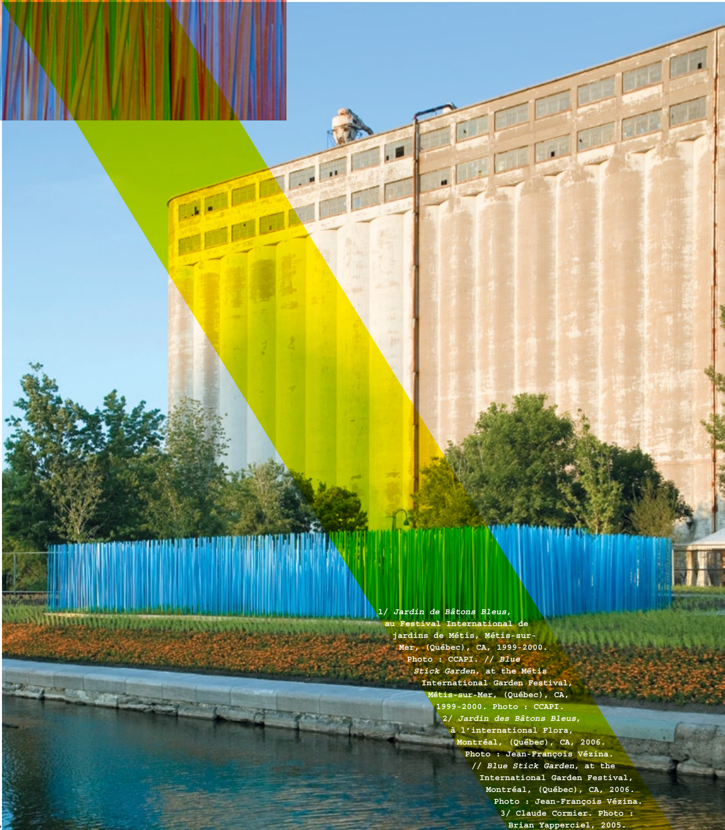
1/ Jardin de Bâtons Bleus, au Festival International de jardins de Métis, Métis-sur- Mer, (Québec), CA, 1999-2000. // Blue